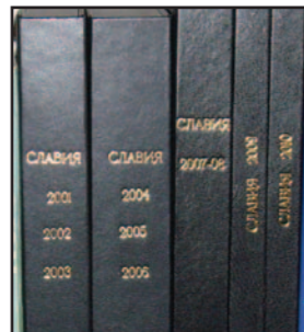
Подвързаните по години томове с вестник „Славия“ – гордост за всяка библиотека

Така стартирахме на 10 април 2001 година. Водени от същия плам направихме за „бялата“ идея тези вече 114 броя. И колкото, и нескромно да звучи смятаме, че на 10 април 2011 всички слависти имат още един празничен повод – нашият-ваш вестник отбелязва своя кръгъл юбилей. Единственото по рода си клубно издание празнува десетия си рожден ден! Вестникът е уникален, защото отразява теми посветени само на „белия“ клуб. Той се списва на доброволни начала от слависти и вече има зад гърба си 114 броя, с този който държите в ръката си или четете в интернет! С голите цифри нещата звучат така: отразените в него спортни дисциплини развивани в „Славия“ са 22, а общия брой на спортовете са 29, защото някои се практикуват и от жени, и от мъже. Журналистите гастролирали на страниците ни са 35. Тук не можем да отбележим всичките имена,