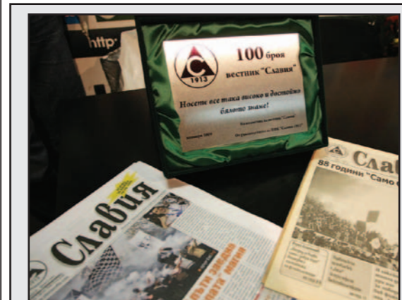
През изминалите десет години екипът на „бялото“ клубно издание не еднократно бе отличаван за своята работа. На снимката почетният плакет връчен от ПФК „Славия“ на редколегиата по случай излизането на стотния брой през ноември 2009 година разположен между юбилейният брой и брой първи от 10 април 2001 година.

Затова в. „Славия“ оцеля, излиза и ще го има и занаяпред. Не само защото иде стогодишнината на доказано най-стария български клуб в момента. Прос-