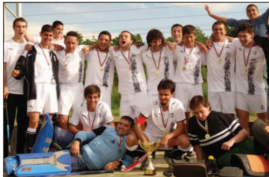
В последната година мъжкият хокеен отбор на "Славия" се превърна в абсолютен хегемон у нас