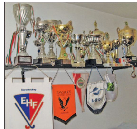
За малко повече от пет години съществуване съставите на "белите" спечелиха цял куп награди от български и международни състезания

дерация изпращат остро писмо до "Славия", в което в ултимативен тон изискват обяснения от "белите" защо са били злепоставени пред Европейската