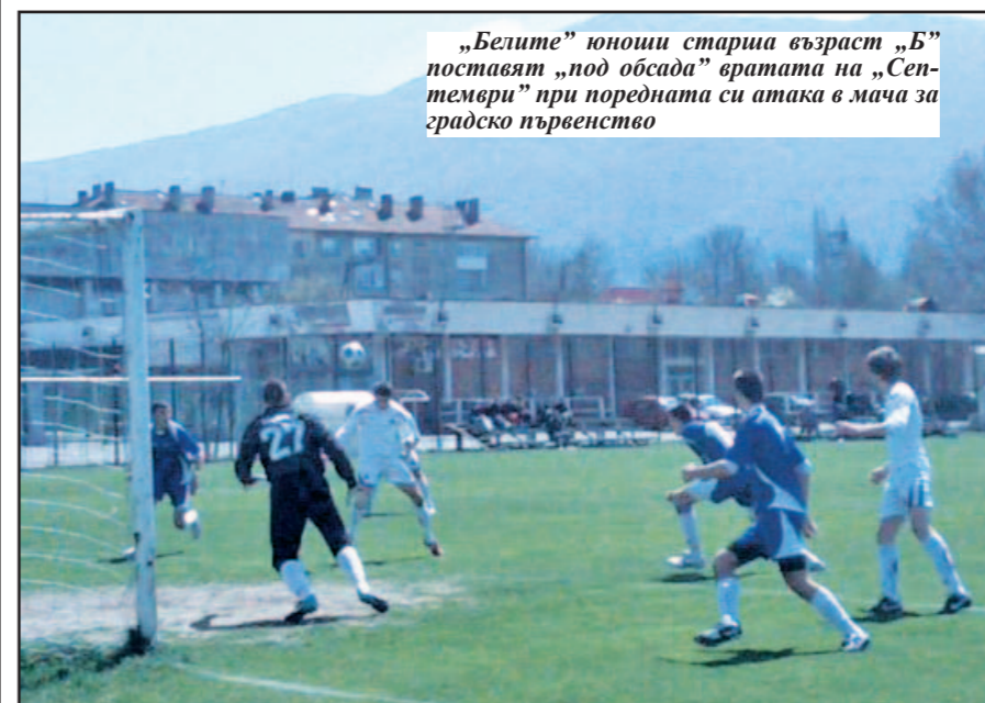
„Белите“ юноши старша възраст „Б“ поставят „под обсада“ вратата на „Септември“ при поредната си атака в мача за градско първенство