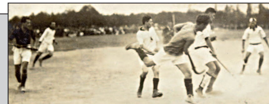
Мач с участие на славистите от първите години на хокея у нас

Интересното е, че въпросното мероприятие в "Албена" съвпада по време и място с Общото събрание на федерацията, което по разкази на очевидци про-