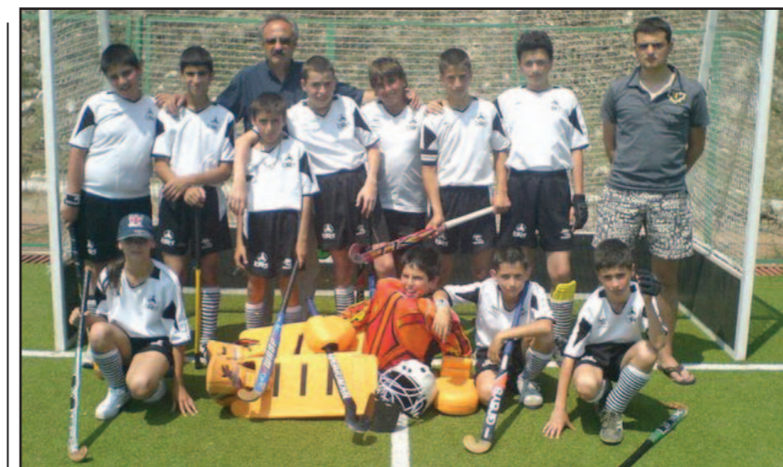
За съжаление след разправата с "белия" клуб голяма част от младите състезавачи се втимяма да продължат със спорта, което е равносилно на предателство спрямо децата...

Оттук насетне циркът става пълен. На 1 февруари