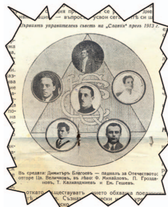
Факсимиле от брой единствен на списание „Славия“ излязло от печат през януари 1925 година с публикувани портрети на първото ръководство на „Белия“ клуб

сти“ (сегашното училище за медицински сестри „Йорданка Филаретова“) стърчеше самотно оградено от ниска дървена ограда (тараба) като от двете