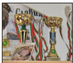
Юбилейният брой 100 стои гордо наравно с най-ценните трофеи на „белия“ хокеен клуб

Този 10 април бе малко по-особен. Не толкова, защото „Славия“ се приближи с още година до столетието. А поради факта, че вестник „Славия“ навърши 10 години.