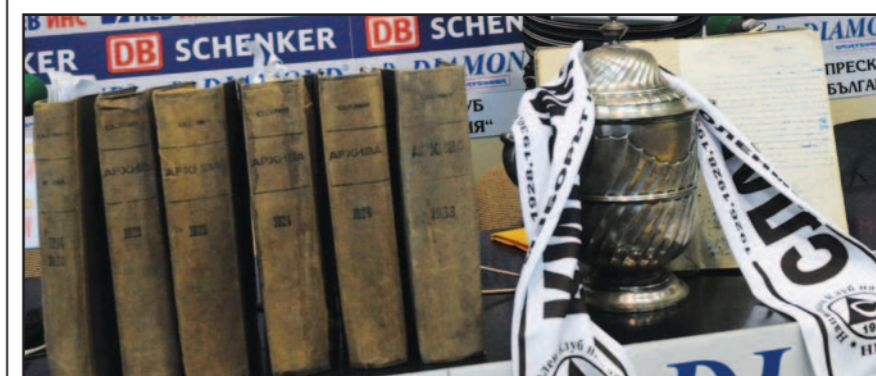
Шестте тома с архиви на „Славия“ гордо стоят до Царската купа и „Бялата библия“

натрупване на напрежение по оста запалняковци – президент на клуба, тръгнало от медийни публикации, откровено не разбрали какво пишат феновете в сайта си. Или не пожелали, или пък тенденциозно нагнетили обстановката в „белия“