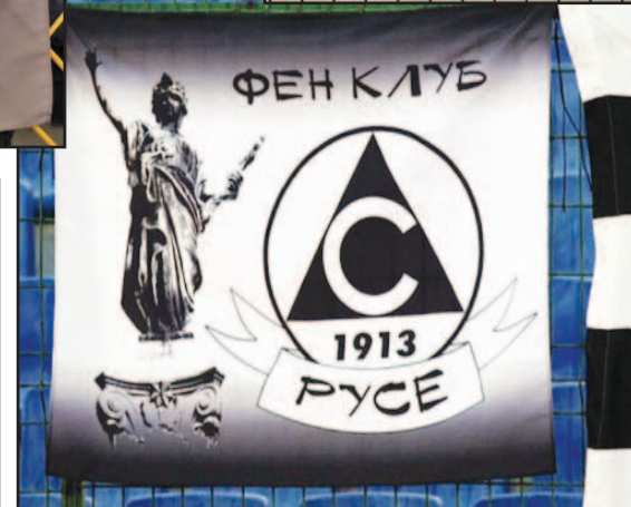
„Белията“ фенклуб в Русе избра за своя емблема символът на града

се вееше гордо и знамена на техни колеги от различни точки на България. Много силна бе групата то Севлиево, не отстъпваха на нея и славистите от Дряново. Със свои трансперанти се отличаваха „белите“ фенове от Велико Търново, Видин, Малко Търново и Русе. Всички слависти дошли от Монтана пък бяха с фланелки на отбора. Сред славистката агитка имаше още поклонници на „бялата“ идея от: Асеновград, Благоевград, Бургас, Варна, Гоце Делчев, Лясковец, Огняново, Пловдив, Плевен, Първомай, Чирпан и тн.