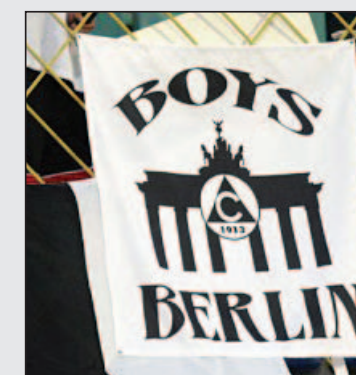
Символ на славистите в Берлин е прочутата Бранденбургска врата

От татък Атлантика също имаше „бели“ фенове. От калифорнийския мегаполис Лос Анджелис и от най-българския, и най-славистки град в САЩ Чика-