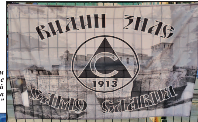
Любовта към „Славия“ е силна и край крепостта „Баба Вида“