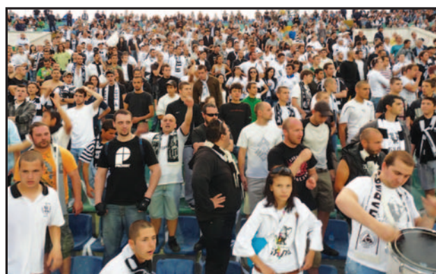
Благодарение на добрата организация, хилядите слависти на финала представляваха монолитно „бяло-черно“ ядро, което не спря да подкрепя своите любимци до край

Малка група от ултрасите на „Славия“ от фракциите „BoysSofia“ и „La Vecchia Scuola“ влезе на стадиона много преди всички останали привърженици да го направят. Още в 16 часа те бяха там, за да наредят своите знамена, легендарния голям трансперант с емблемата на „Славия“, както и дълго обмисляната хореография от около 1000 бели и черни знаменца. Всичко бе подготвено с часовникарска прецизност. Над редовете със знаменцата бяха издигнати големи трансперанти с всяка една от годините, през които „Славия“ е печелил