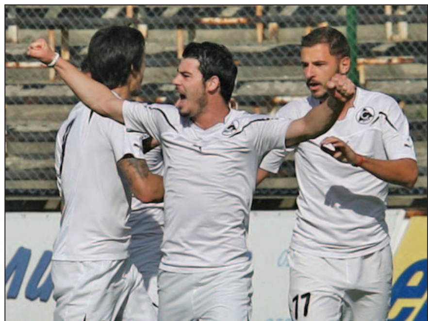
„Белите“ се радват след реализирания победен гол във вратата на ЦСКА

“Белия” клуб отново остана далеч зад челната тройка, записвайки трагично представяне в мачовете в “А” група. Неучастие в европейските клубни турнири едва ли учудва някого, но 11-ото място в крайното класиране и безобразните ма-