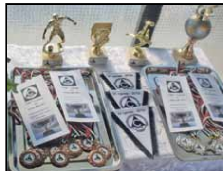
Освен шампионския трофей организаторите бяха приготвили индивидуални призове, медали, както и програмки