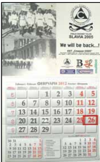
Календарът на клуба по хокей на трева „Славия-2005“ за 2012 година с недвусмисленото лого: „We will be back...!“

Навярно повечето от вас си спомнят, как след като през 2010 славистите спечелиха всички състезания в България на открито и в зала от федерацията се разправиха с клуба, и го изключиха. От тогава върви и съдебната битка на „Славия-2005“,