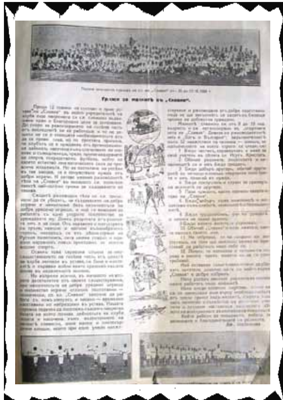
Факсимиле от материала „Грижи за малките в „Славия““ поместен на 17 страница в юбилейното списание „Славия“ от 1925 година

Малките слависти са от 8 до 15 годишна възраст и са организирани в спортната чета на „Славия“. Девиз на ръководителите им е „Бог и България“. Задължителните пък 12 напътствия към четника-юноша за изпълнението, на което строго се следи са: