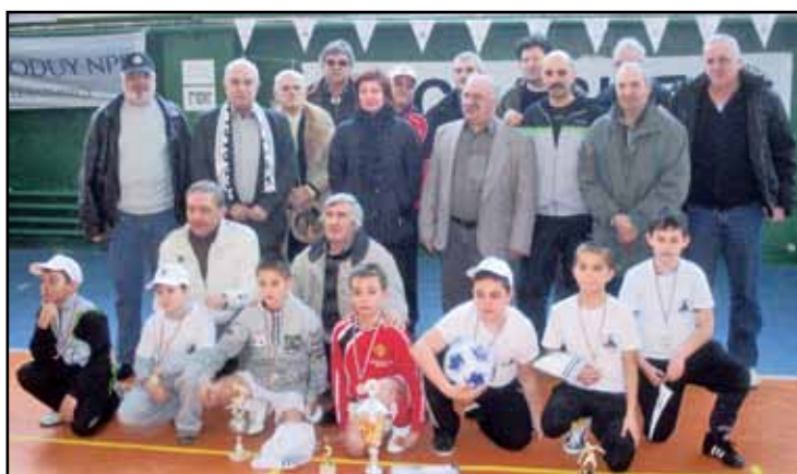
Традиционната снимка на част от организаторите на проявата и състава победител