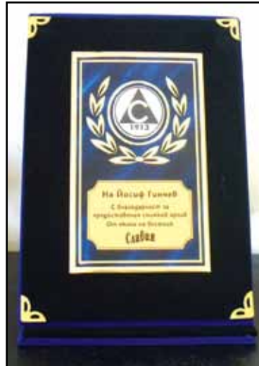
Плакетът, връчен от екипа на „белия“ вестник

На кадрите предоставени от него са уловени редица знакови за „Славия“ събития от споменатата декада. Сега предстои нелеката задача да се обработи архивът и да се дадат за копиране няколко стотин фотоса, което е свързано и с подsigуряването на немалко средства, защото размерът на лентите е не-