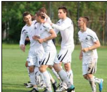
Дано моментите с радващи се „бели” футболисти да бъдат нещо обичайно и напролет в детско-юношеските групи на „Славия”

за юношеска Шампионска лига. Тогава най-та-