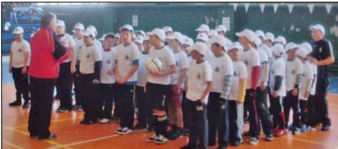
Близо 60 козлодуйски деца облечени с фланелки и шапки с емблемата на „Славия“ участваха

И тази година между-срочната ваканция бе най-радостният период за децата в крайдунавския град. За 9-и път местните слависти организираха проявата "Деца играят футбол с емблемата на "Славия". В надпреварата по традиция се включиха шест тима - по два от всяко от трите училища в града. Турнирът в Козлодуй този път спечели вторият отбор на СОУ "Св. Кирил и Методий". Но традиционно награди имаше за всички участници над 50 деца в състезанието осъществено от Регионалния клуб на слависта. За всички малчугани имаше много лакомства и календари на ПФК „Славия“ 1913 АД, за всеки отбор по една торта, а за заелите първите три места състави и медали, за победителите и разкошна купа. Важно е да се отбележи, че догодина, когато ще стартира 10-ият юбилеен турнир, той ще е част от празненствата на „белия“ клуб за неговата стогодишнина.