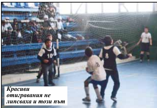
Красиви отигравания не липсваха и този път