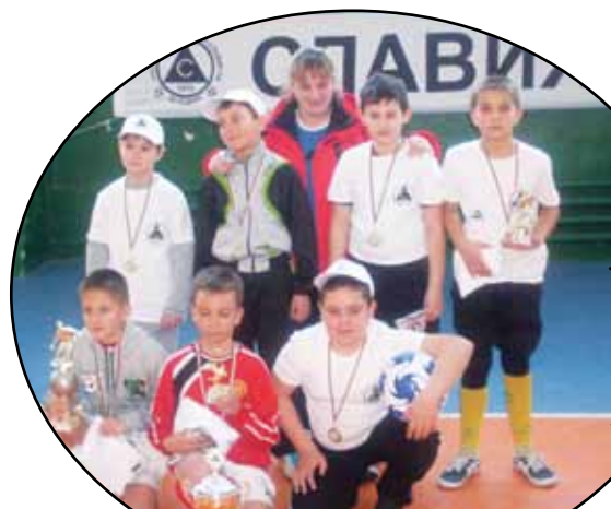
Победители този път бяха учениците от втория отбор на СОУ св. св. "Кирил и Методий"