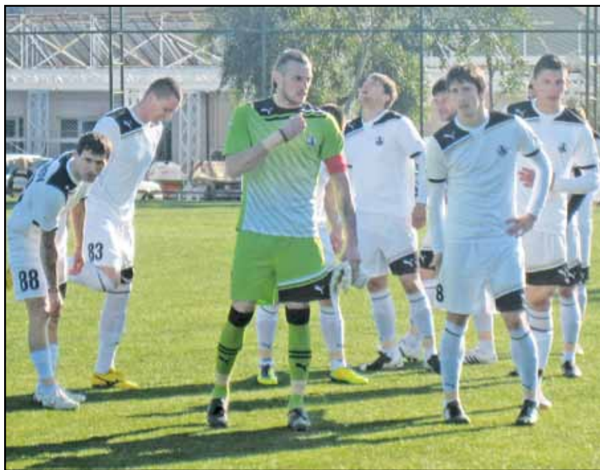
Славистите преди поредната контрола на турска земя