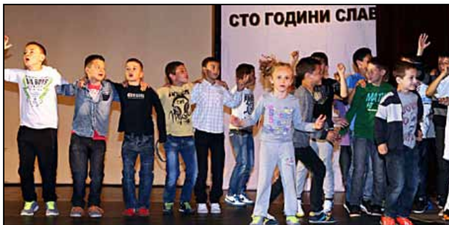
Прекрасна гледка бяха стотиците деца скандиращи спонтанно „Славия“ на сцената в НДК

Освен проекцията на лентата на сцената звучаха изпълнения на рокджииите от „Импулс“ и „Спринт“, които пък представиха уникалния проект – „Белият албум“. Освен това в НДК се продаваше алманахът „100 го-