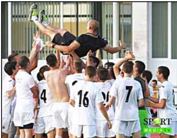
Футболистите отдават заслуженото на своя млад треньор