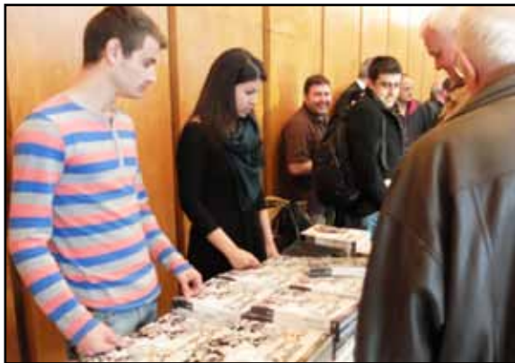
Пред щанда с книгите се изви дълга редица от чакащи да си купят изданието слависти