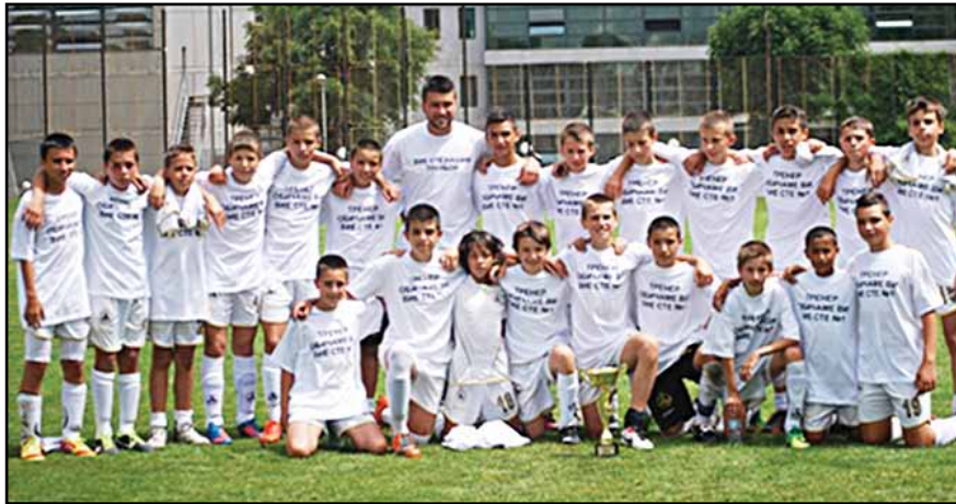
„Белите” шампиони на София, родени през 2000-ата година

„Белград”, заемайки второто място в класирането в групата. На полуфиналите славистите победи драматично с 4:2 след изпълнение на дузпи друг сръбски тим „Чукарнички”, а в редовното време