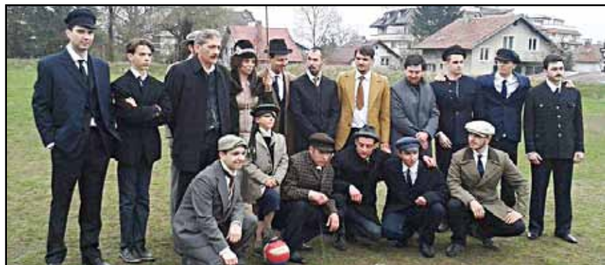
Снимката пресъздава паметните моменти на 10 април 1913 година в „два часа след пладнe на полето край Руски паметник“

часа. След това в калпа на полето в Бояна участниците във възстановката имаха възможност да покажат част от футболните си умения, въпреки че времето беше типично пролетно и дъждовно. „Денят бе мрачен, но душите ни светли. Обстановката при „Яфата“ ни отведе там преди 100 лета в идеалите и ценностите на нашите основатели. Понеже ние „артистите“ се снимахме за първи път в нас имаше вълнение,