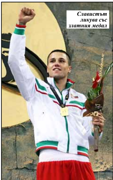
Славистът ликува със златния медал