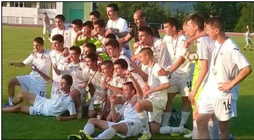
Заслужена радост с шампионската титла

„Славия“ стана републикански шампион при децата, родени след 1 януари 1999-а година и за пореден път доказва, че разполага с една от най-силните и качествени детско-юношески школи в България. На финала в Правец „белите“ победиха ЦСКА с 4:1 след изпълнение на дузпи. В редовното време двата отбора завършиха наравно 1:1.