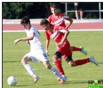
Славистите контролираха събитията на терена във финала

шите на най-стария български клуб вкараха четири пъти от четири удара от бялата точка, докато ЦСКА направи два пропуска от три опита и така крайният резултат стана 4:1.