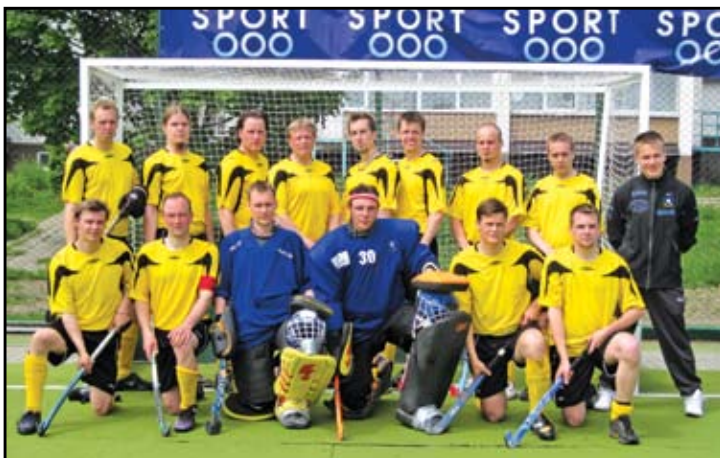
„Сейнайюки Юнайтед“ (Финландия)