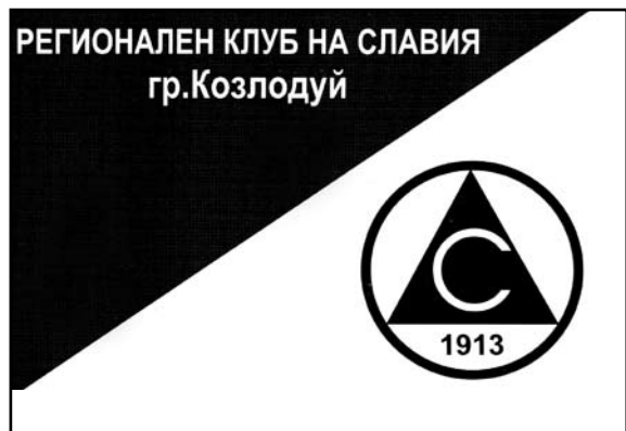
Славистите в Козлодуй с календарче и за 2007