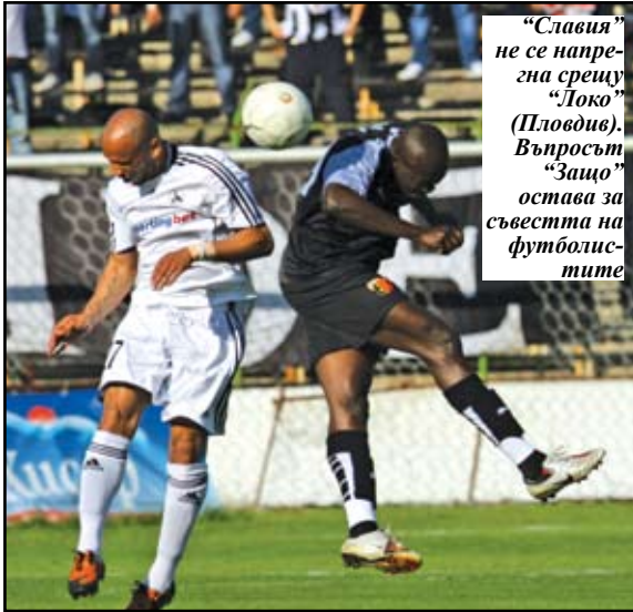
“Славия” не се напрегна срещу “Локо” (Пловдив). Въпросът “Защо” остава за съвестта на футболистите