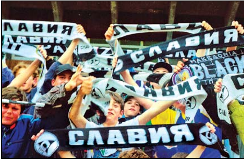
Първото календарче на „бялата“ агитка е за 2000 година