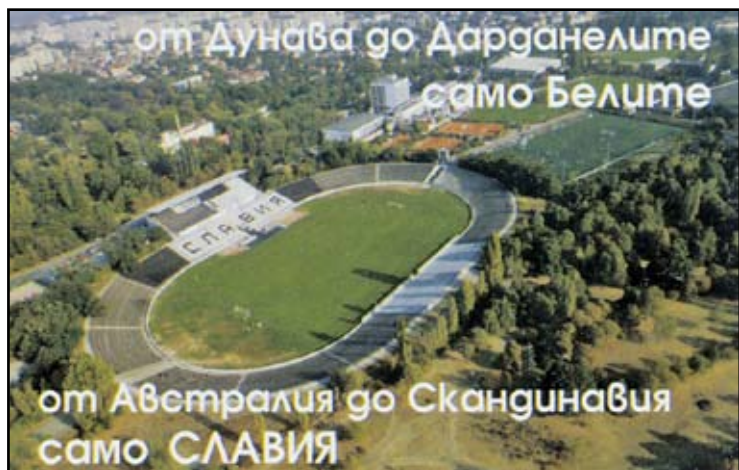
Уникалният фотос за 2009