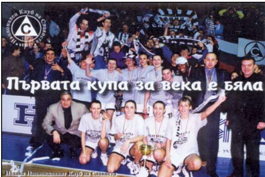
Баскетболната купа вдъхнови фотоса за календарчето за 2002