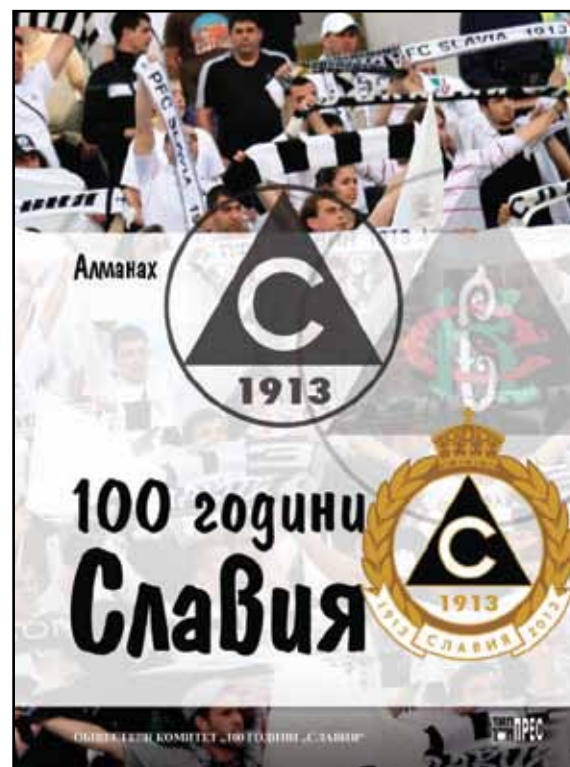
Корица на новата книга за „бялата“ история