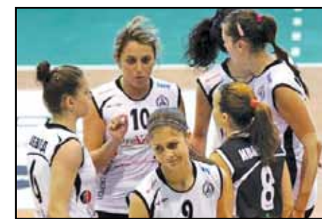
Младите славистки вече загатнаха за големия си потенциал