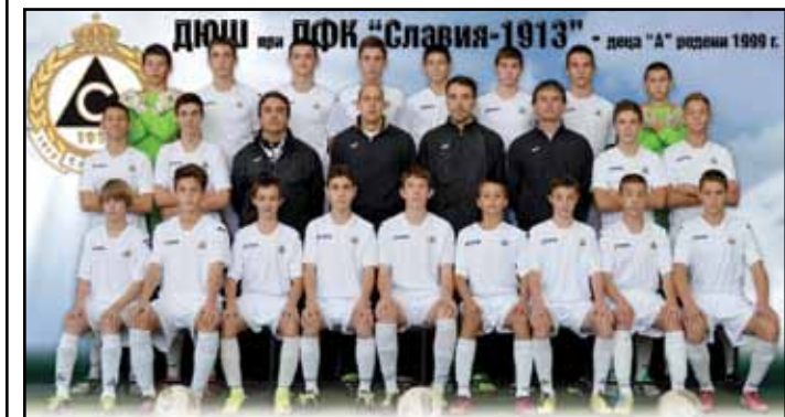
Отборът на "Славия" деца "А", родени 1999-а година, е убедителен лидер в софийското първенство след есенния дял