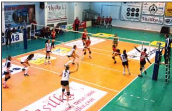
Този път „Славия“ не успя да спечели срещу „Казанлък“

Волейболистите на „Славия“ продължават с утвърждаването на позициите си от 2013 година. „Белите“ не допускат изненада срещу