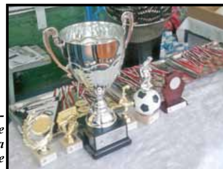
Прекрасни награди имаше и този път за най-добрите