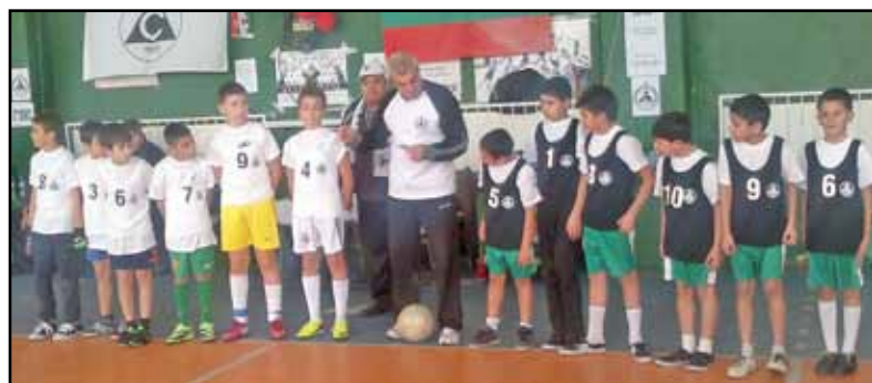
Отборите строени преди началото на поредния мач