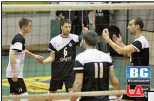
Младите слависти все още не могат да намерят победния ритъм

Последвалото домакинско поражение от „Пирин“ (Разлог), също с 0:3, отново доказва за проблемите, които имат