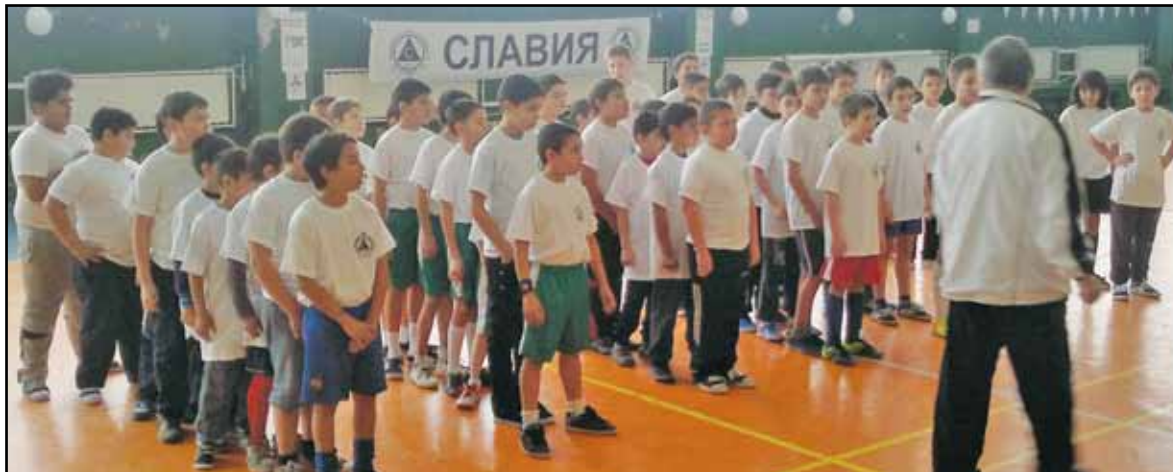
Десетки деца от крайдунавския град застанаха на старт и през 2014 година в надпреварата „Деца играят футбол с емблемата на „Славия“