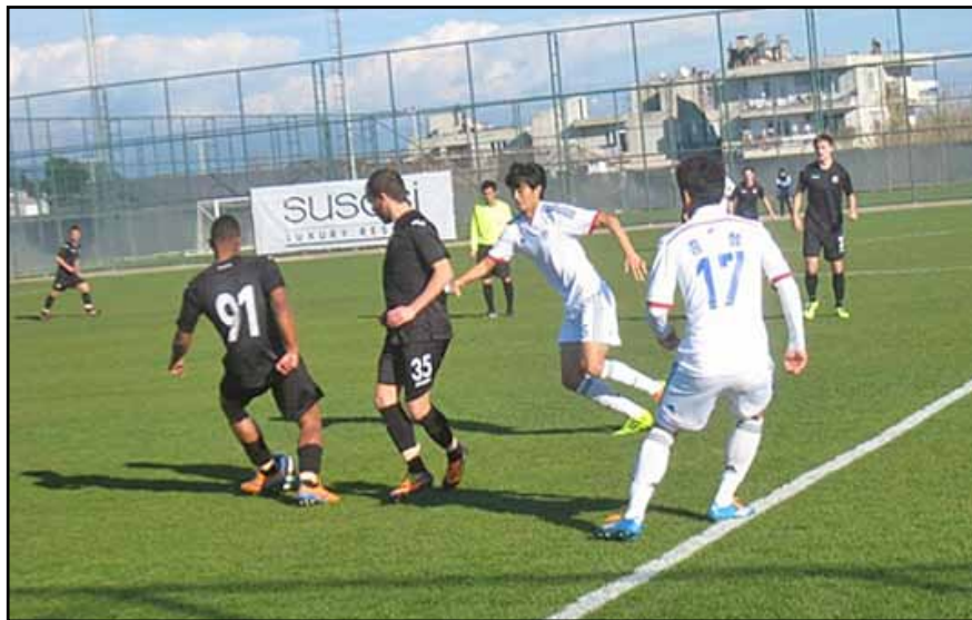
Срещу корейския „Самсунг“ (Сувон) славистите, в тъмни екипи, спечелиха най-авторитетната си победа в зимния подготвителен период на 2014 г.

М ного трудно е да си спомним зимен подготвителен период, в който отборът на „Славия“ от 6 мача да е спечелил пет победи и да е загубил само една контрола, в която излезе с много млад и експериментален състав. Още повече, че в цели пет срещи вратата на „белите“ остана непоразена от съперника.