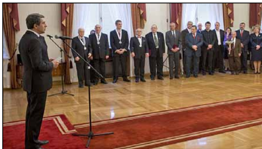
Президентът на България Росен Плевнелиев отправя приветствие към лауреатите и гостите на церемонията от 12 февруари 2014 г.