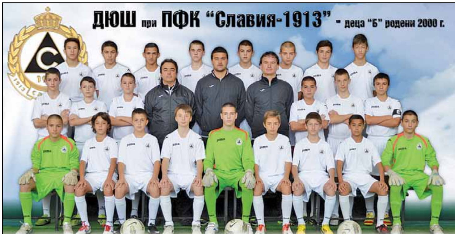
ДЮШ при ПФК "Славия-1913" - деца "Б" родени 2000 г.